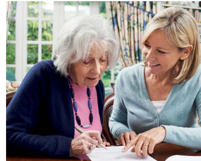
Gut betreut im Alter.

Fragen Sie uns – wir können viel für Sie tun!