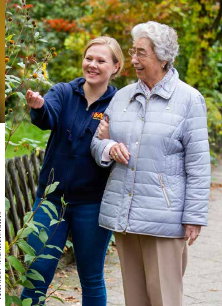
Stand: 1/2023