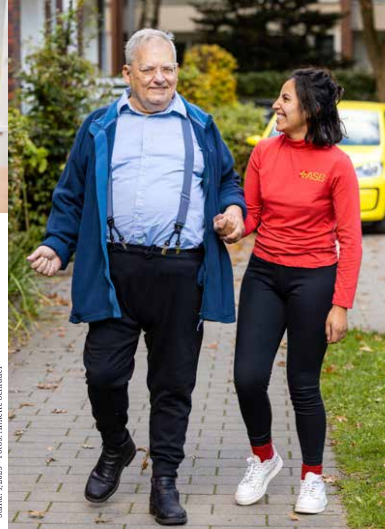
Stand: 1/2023