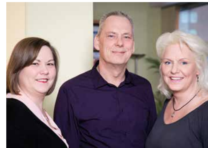
Ihre Ansprechpartner in der Sozialstation

Fragen Sie uns – wir können viel für Sie tun!