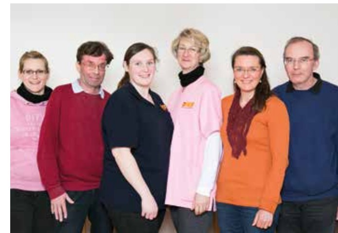
Ihr ASB-Pflegeteam in der Sozialstation Dulsberg.

Fragen Sie uns – wir können viel für Sie tun!