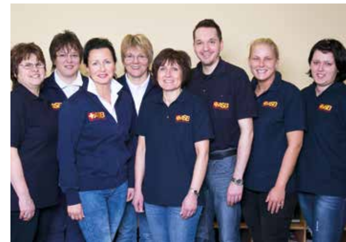
Ihr ASB-Pflegeteam in der Sozialstation Bramfeld.

Fragen Sie uns – wir können viel für Sie tun!