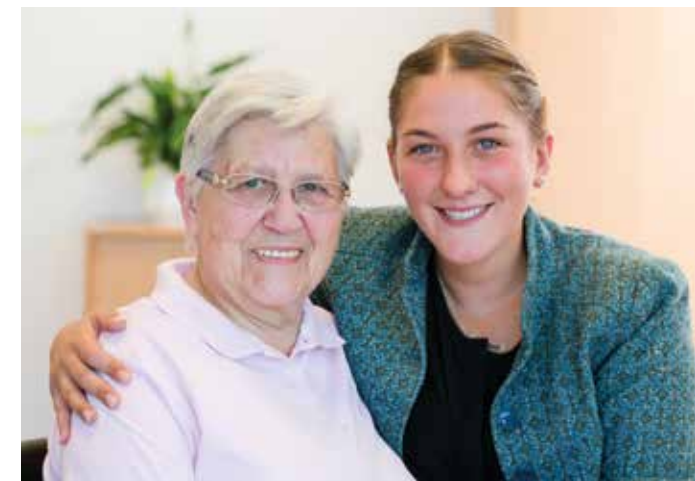
Gut betreut im Alter.

Fragen Sie uns – wir können viel für Sie tun!