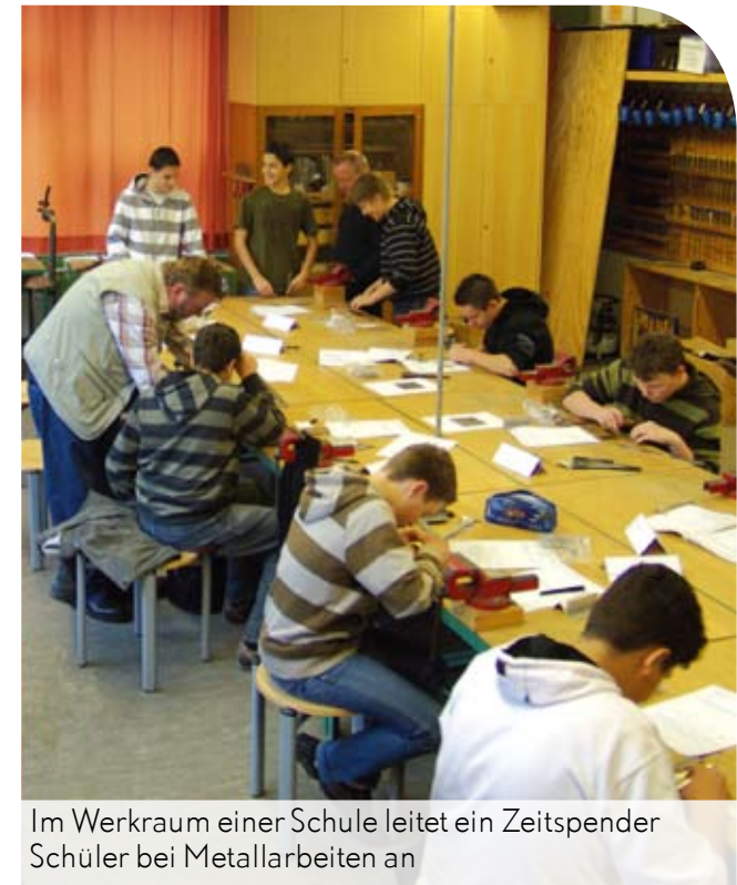
Im Werkraum einer Schule leitet ein Zeitspender Schüler bei Metallarbeiten an

Das in Hamburg einzigartige Projekt gibt es seit 2005. Es begann an der Ganztagschule Veermoor in Lurup. Ihr Schulleiter hatte die Zeitspender-Agentur des ASB um Unterstützung gebeten. Es fanden sich sieben Handwerker für den berufsfördernden Unterricht. 2007 gewann diese Schule den Landeswettbewerb des deutschen Hauptschulpreises.