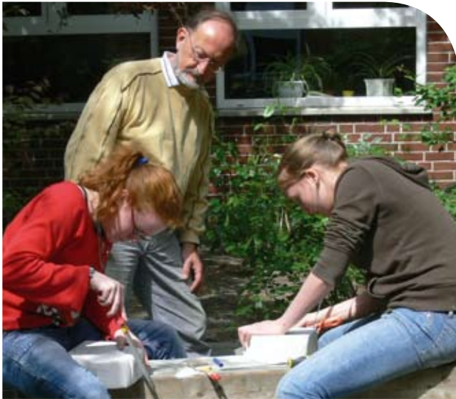
Ein Zeitspender begutachtet, wie zwei Schülerinnen Porenbeton bearbeiten