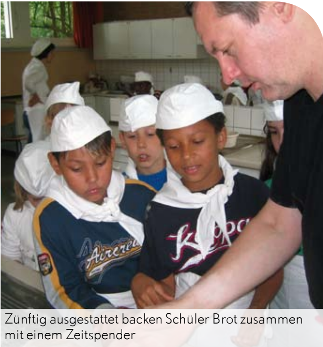
Zünftig ausgestattet backen Schüler Brot zusammen mit einem Zeitspender

Sie haben handwerkliche Fähigkeiten, Zeit und hätten Lust, Jugendlichen ehrenamtlich Grundkenntnisse in Ihrem Handwerk zu vermitteln.