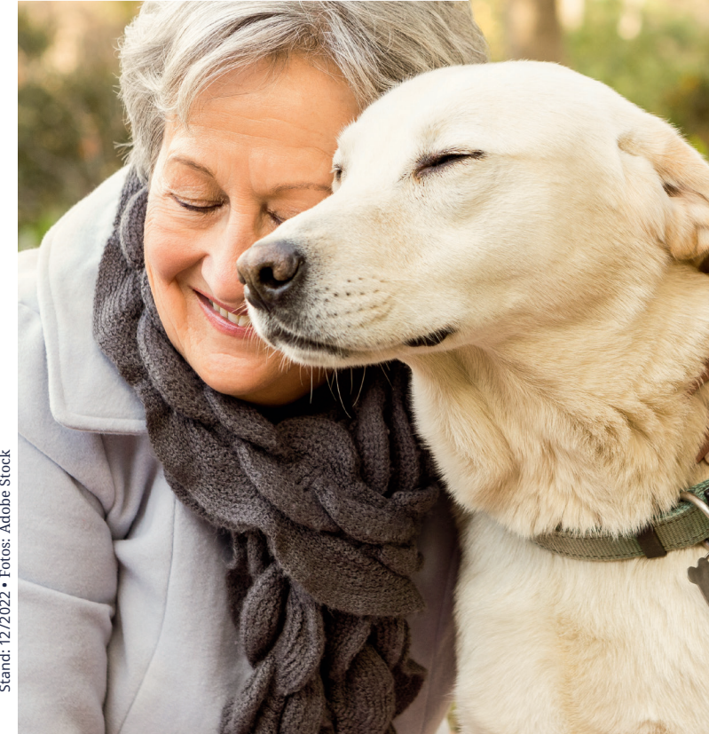
Stand: 12/2022 • Fotos: Adobe Stock